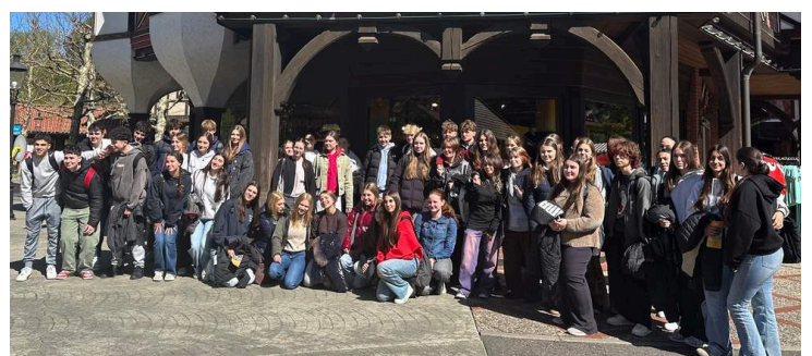
Text & Bild: Petra Lafferenz

Vielen Dank für diese einzigartige Erfahrung!