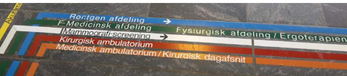
Wegweiser im Krankenhaus in Rønne