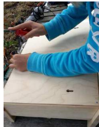
Bau des Insektenhotels

Beim Bau der neuen Bänke legte unter anderem unser Schulleiter mit Hilfe von Eltern Hand an und tauschte den Rotstift gegen Hammer und Schraubendreher, damit für die Schüler neue Sitzgelegenheiten entstehen konnten. Eine sehr gute Idee war das Beschriften der Wege. Fragte man sich sonst immer, wo ist denn bitteschön das F- oder B-Gebäude, wird man bald nur der Linie folgen können um sicher ans Ziel zu kommen. Bisher wurden erst zwei Wege angefangen zu markieren, es werden jedoch nach Fertigstellung vier verschiedene Farben zu sehen sein. Eine tolle Verbesserung, vor allem für die neuen Schüler oder auch beim Tag der offenen Tür. War der oder die Ideengeber eventuell einmal auf Bornholm im sykhuset (Krankenhaus)? Dort werden die Wege auch so markiert, was besonders angenehm ist, wenn man ohne die Sprache zu kennen mit Farbangaben zum Ziel kommt.