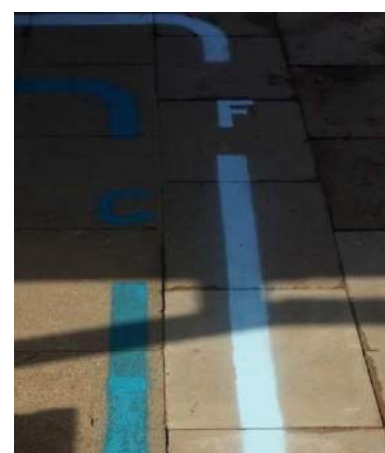
Wegweiser im CvO - noch zweifarbig, geplant vierfarbig